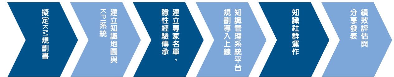
三卯鍛壓知識管理推動步驟